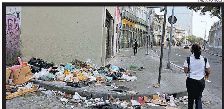
Lixo toma calçadas da cidade, como essa no Centro

Antes da reunião, o prefeito Eduardo Paes publicou uma denúncia nas redes sociais: uma série de fotos e vídeos que mostram a ação de pessoas espalhando lixo pe-